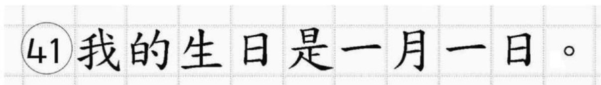
Рис.18. Образец написания иероглифических знаков

Бланк ответов № 2 (лист 1 и лист 2) по китайскому языку (рис. 16 и рис. 17) предназначен для записи ответов на задания с развернутым ответом по китайскому языку (строго в соответствии с требованиями инструкции к КИМ ЕГЭ и к отдельным заданиям КИМ ЕГЭ). Каждый иероглифический знак и каждый знак препинания следует писать внутри отдельной клетки в поле ответов бланка ответов № 2 (дополнительного бланка ответов № 2) (рис. 18).